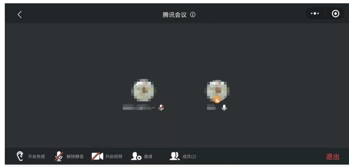
◆ 手机端“微信小程序”界面